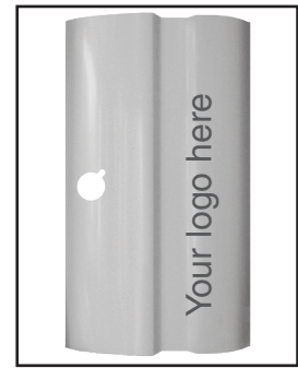
Die Bleche können individuell auf Dutzende von verschiedenen Weise angepasst werden, zum Beispiel durch das Logo Ihres Unternehmens.