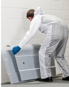
Das Q-PANEL Trainingssystem für die Autoreparaturlackierung ist eine kostengünstige Simulation von Motorhauben und Kotflügeln.

Diese kundenspezifischen Prüfbleche sind am kosteneffektivsten, wenn die Mengen ausreichen, um einen wirtschaftlichen Produktionslauf zu ermöglichen, und wenn das Material aus unserem Lagermetall oder leicht verfügbaren Legierungen verfügbar ist. Kontaktieren Sie Q-Lab jetzt mit Ihren Spezifikationen für kundenspezifische Prüfbleche!