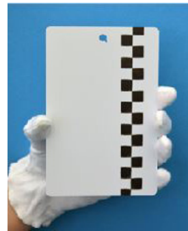
Eine Vielzahl verschiedener vorlackierter, gemusterter und anderer kundenspezifischer Prüfbleche kann auf Anfrage angefertigt werden.